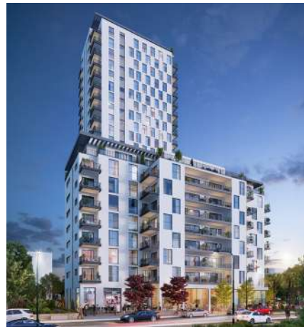
אילת 96-98, חולון

החברה להתחדשות עירונית הינה אחת משלושת החברות הגדולות בישראל בתחום ההתחדשות העירונית, עם ניסיון בהובלה של כ-60 פרויקטים מוצלחים ולמעלה מ-20,000 יחידות דיור ברחבי הארץ. ב-3 השנים הקרובות צפויה החברה לבנות מדי שנה לפחות 2,000 יחידות דיור, בהיקף עסקאות כולל של מיליארדי שקלים.