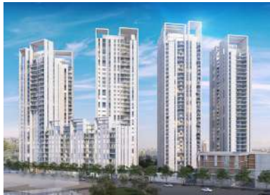
NEXT ביל"ו, בת-ים