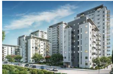
רמת אביב הירוקה