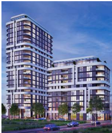
קרניצי מבוא יהל"ם, רמת גן