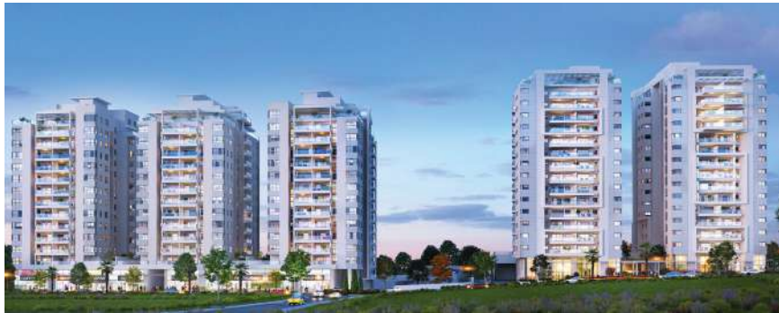
NEO בגבעה, גבעת שמואל