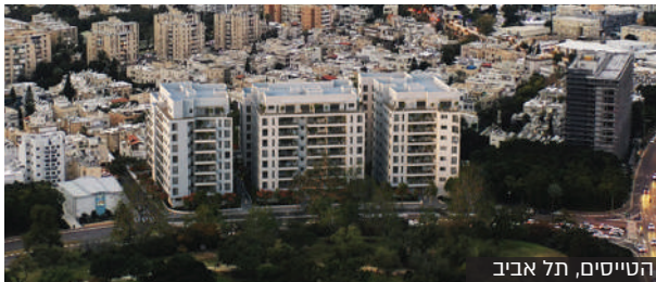
הטייסיים, תל אביב