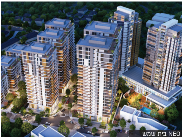
NEO בית שמש