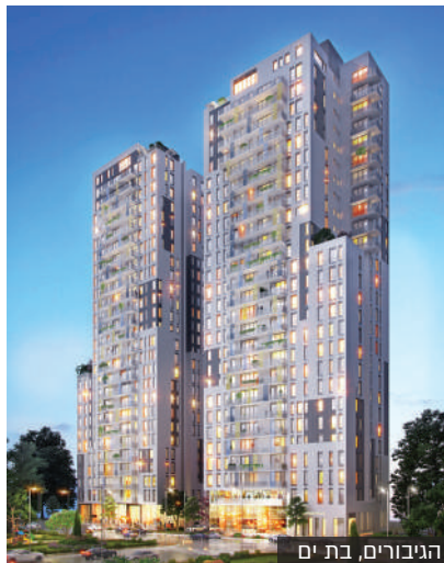
הגיבורים, בת ים