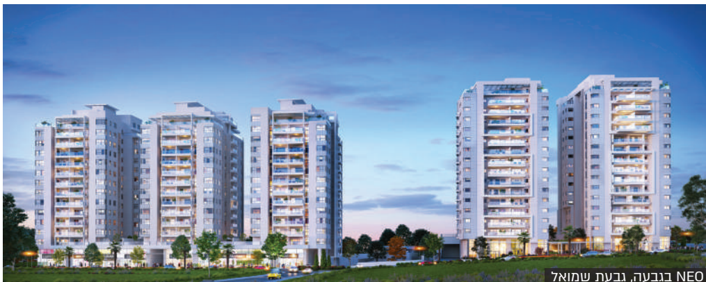
NEO בגבעה, גבעת שמואל