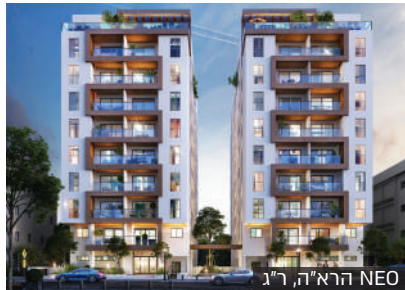
NEO הרא"ה, ר"ג