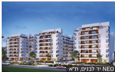
NEO יד לבנים, ת"א