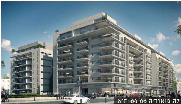
לה-גווארדיה 64-68, ת"א