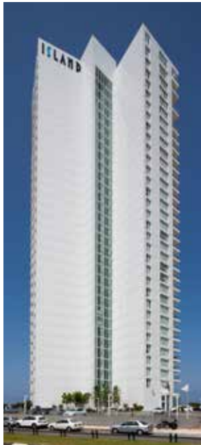
מלון איילנד, נתניה