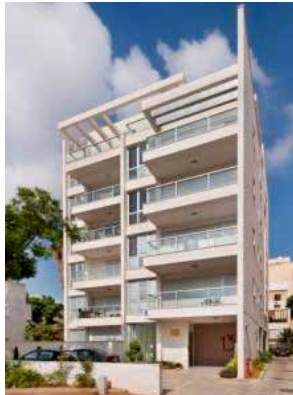
החלוץ 13, הרצליה