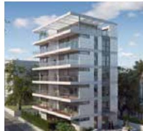
סירקין 18, הרצליה