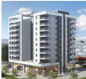
הרצל 85, נתניה