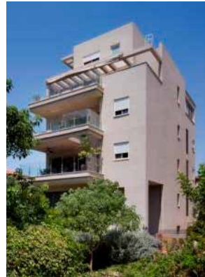
יהודה הלוי 7, הרצליה