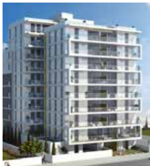
סוקולוב 43-45, הרצליה