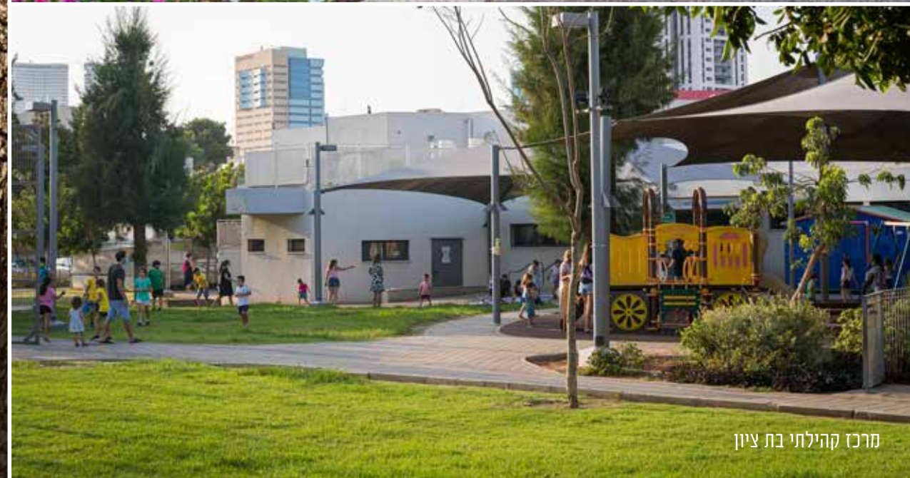
מרכז קהילתי בת ציון