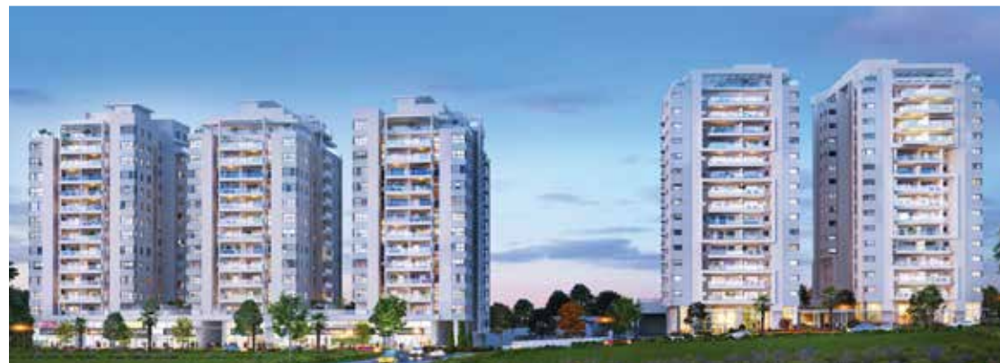
NEO גבעת שמואל