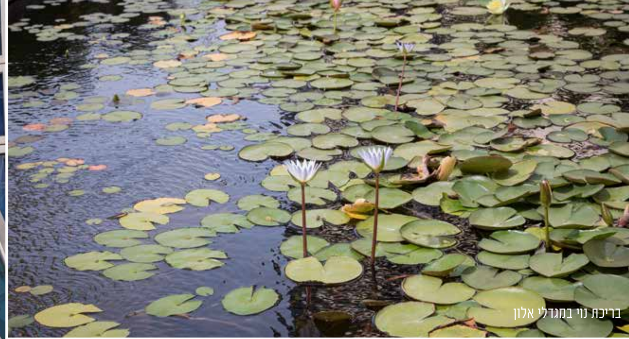
בריכת נוי במגדלי אלון