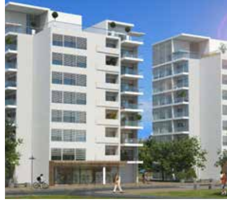
NEO NS ציונה