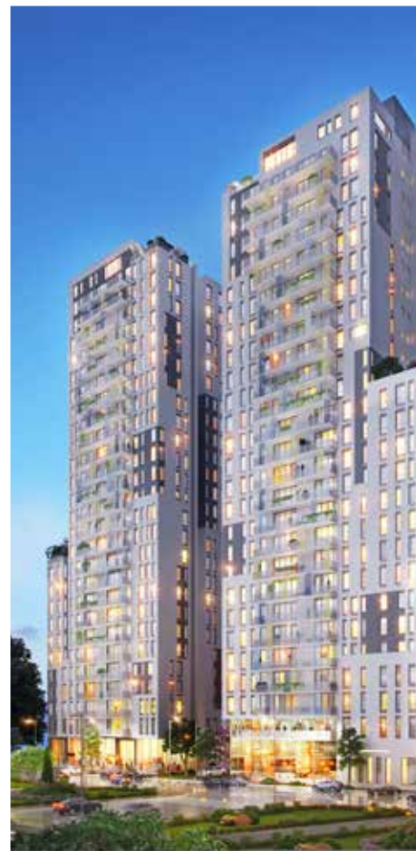
NEO הגיבורים, בת ים