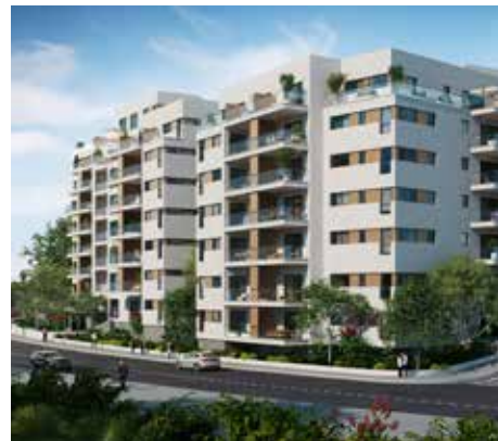
דרך הטייסים, תל אביב