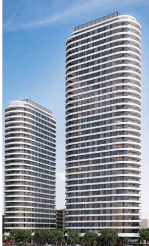
NEO חנה סנש, בת ים