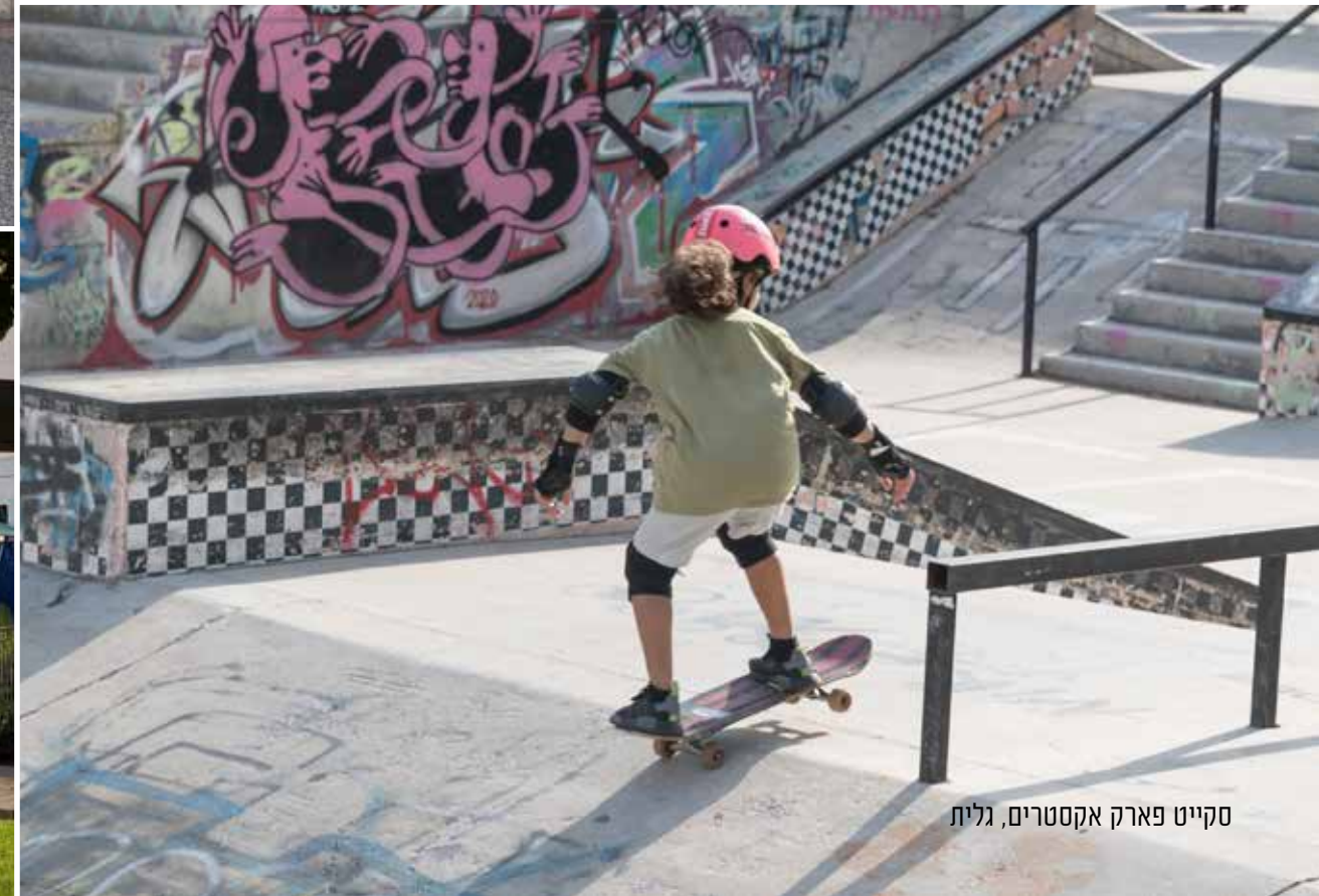
סקייט פארק אקסטרים, גלית