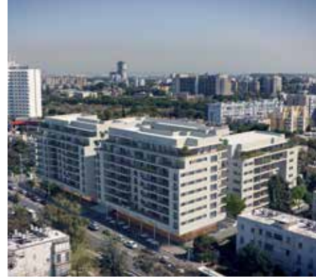
לה גווארדיה 64-68, תל אביב