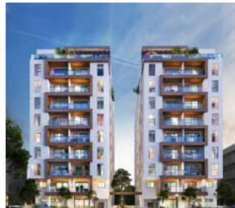
NEO הרא"ה, רמת גן