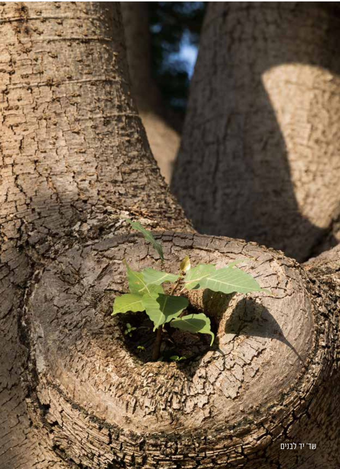
שד' יד לבנים